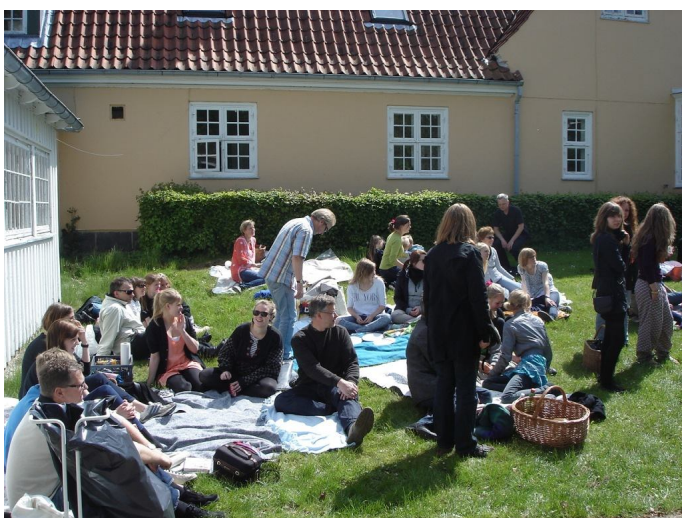
Picnic på græsplænen.