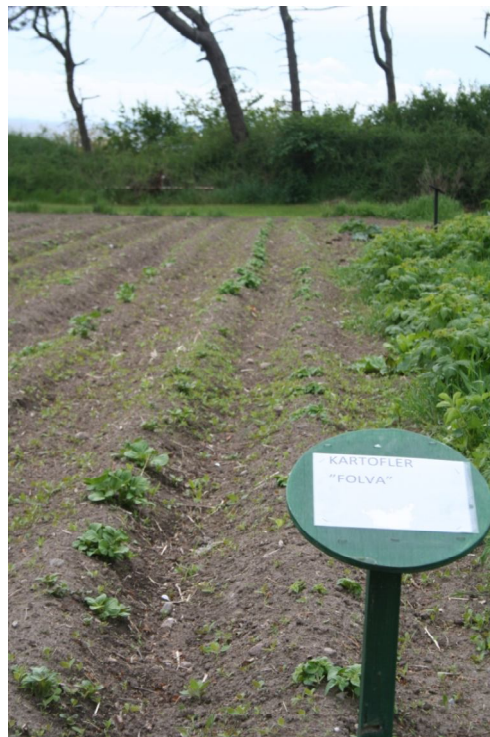
Frugten af arbejdsdagen i april. 3 uger senere var kartoflerne kommet op.