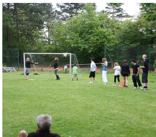
- og den obligatoriske rundboldkamp.