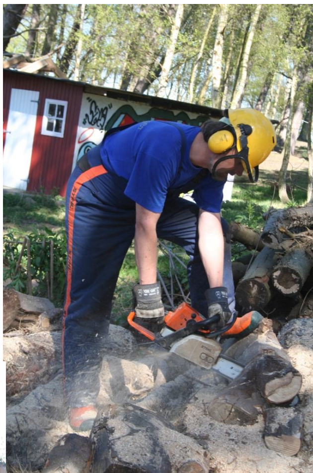
Formanden for skolekredsen svinger motorsaven.

Syholdet fremstillede de største og mest fantastiske gulvpuder, som helt sikkert vil vække glæde fremover.