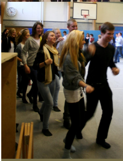
Den første instruktion af folkedans..