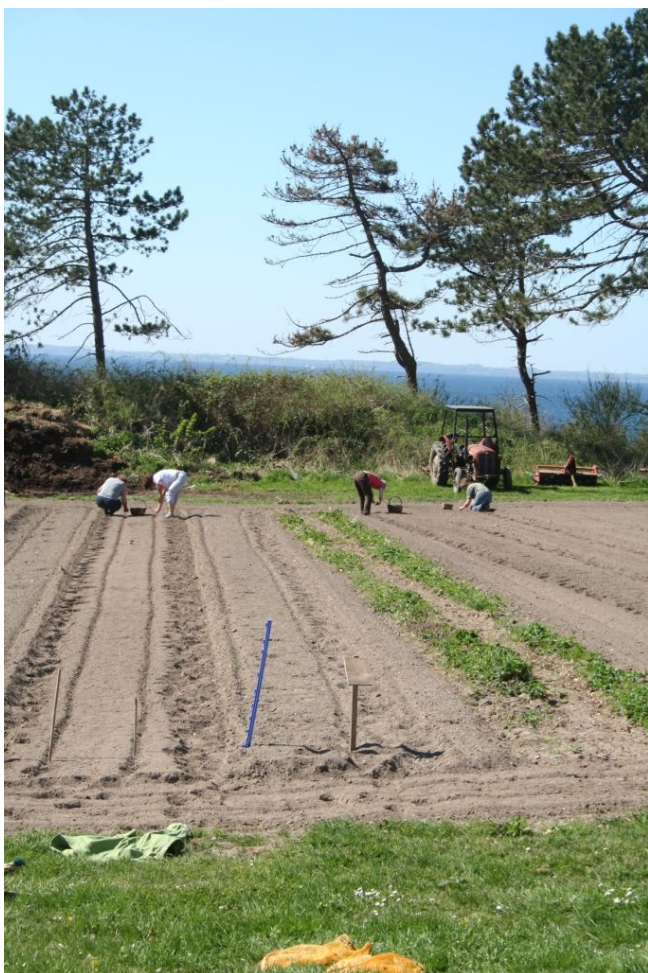
Der blev lagt kartofler....

Da vi efter en hård, men skøn arbejdsdag var blevet vasket og havde pustet lidt ud, kom vi til spisehuset / restauranten, hvor vi blev vist hen til vores bord af de elever fra Kok-amok der havde rollen som tjenere.