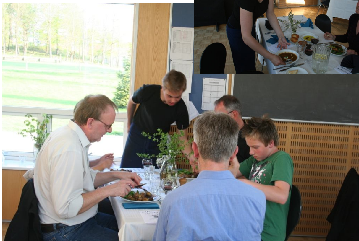
Perfekt servering i restaurant Kok amok