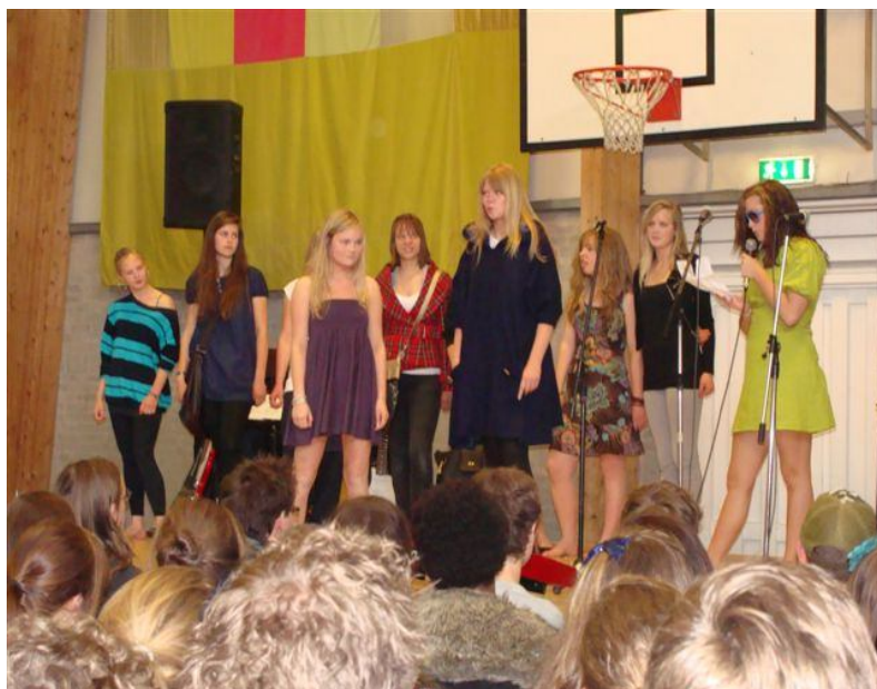
Designlinjen præsenterer deres kreative produkter.