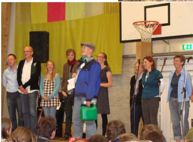
Præsentation af lærerne for kommende elever