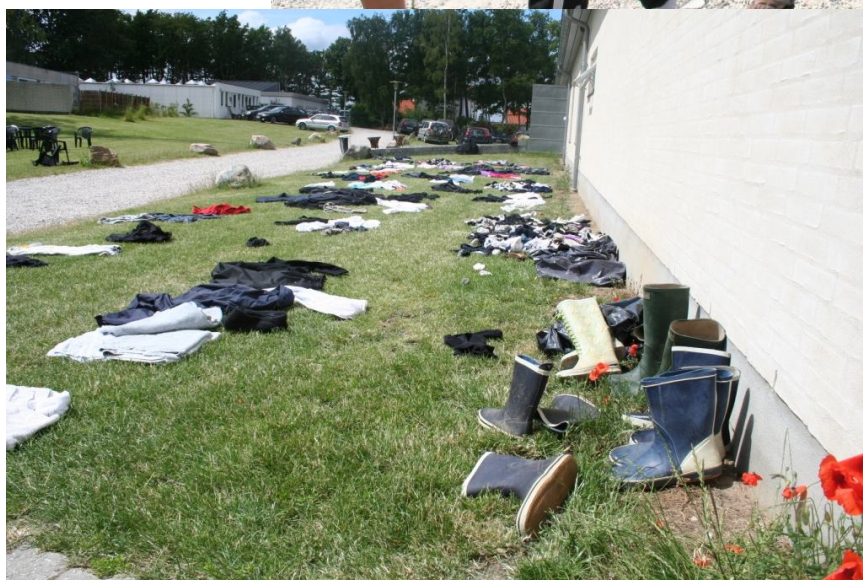
Glemte sager år- gang 08/09!