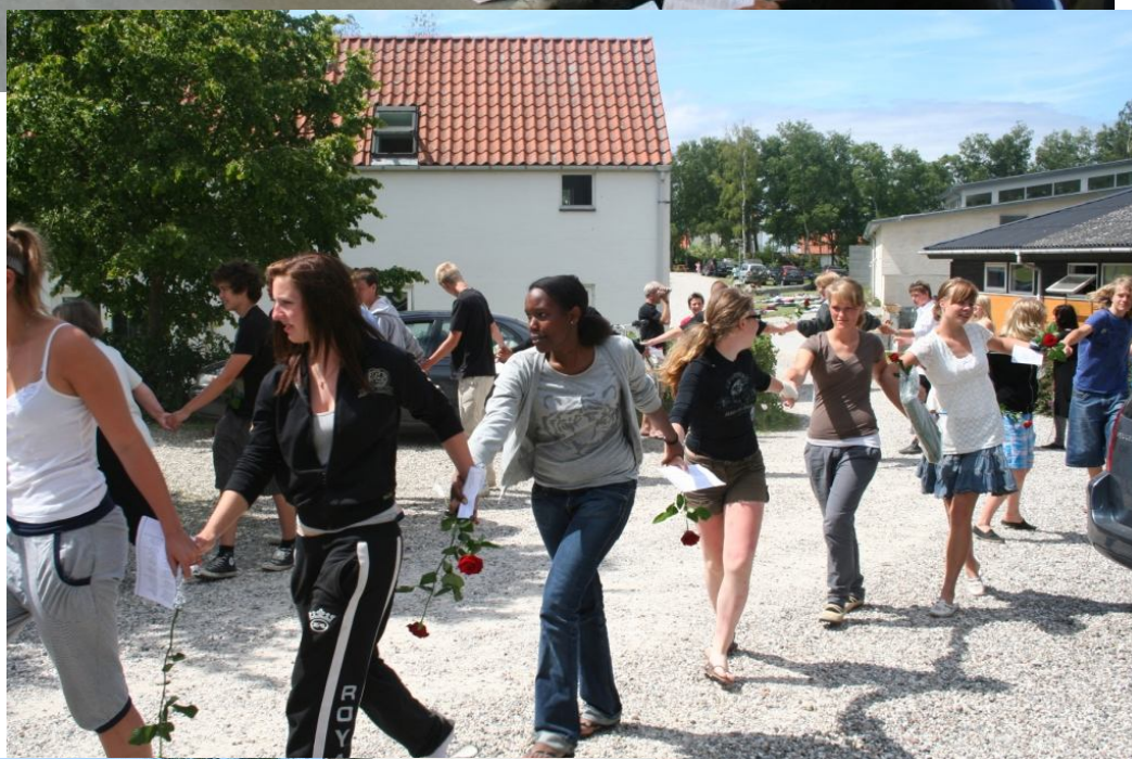
"Uddansning" årgang 08/09