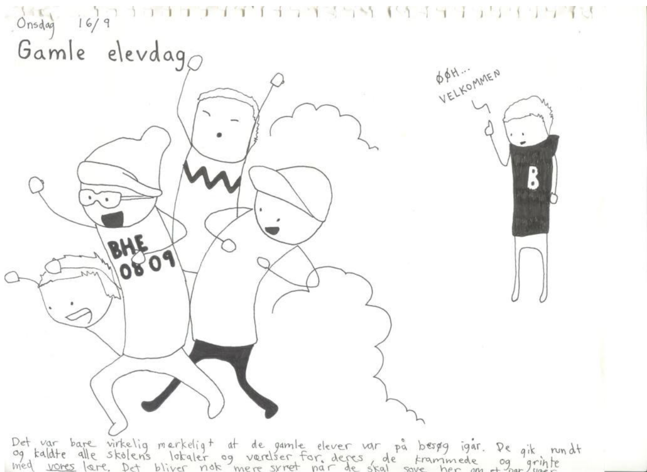
Tegning af Simon