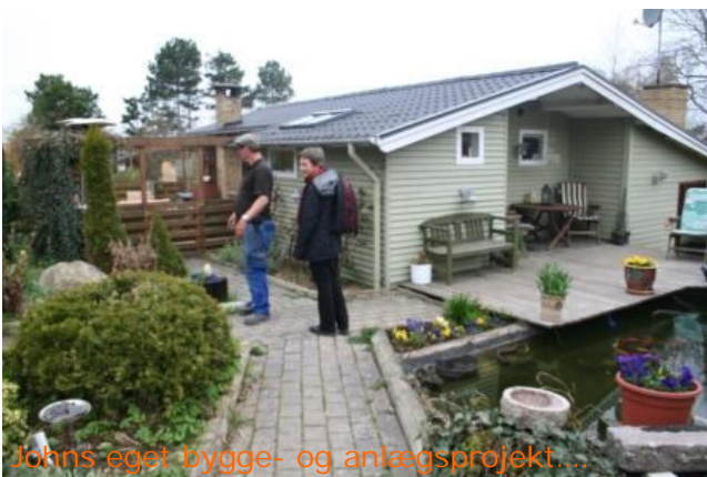
Johns eget bygge- og anlægsprojekt...

Da vi lukkede firmaet, solgte vi huset i Slagslunde og flyttede til Kulhuse. Her så jeg i en lokalavis, at efterskolen manglede en pedel. Jeg tænkte, at det kunne da være