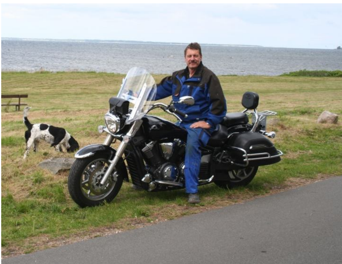
En af Johns hobbyer.....