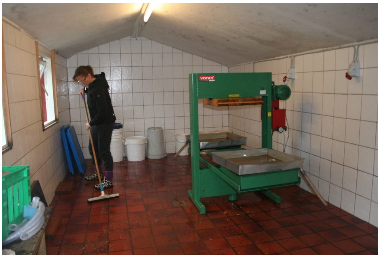
Lokalet og pressen rengøres