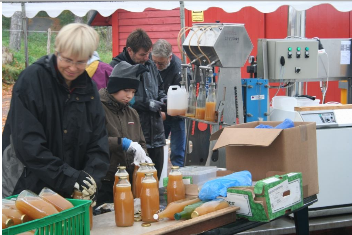
Saften pasteuriseres og hældes på flasker og dunke